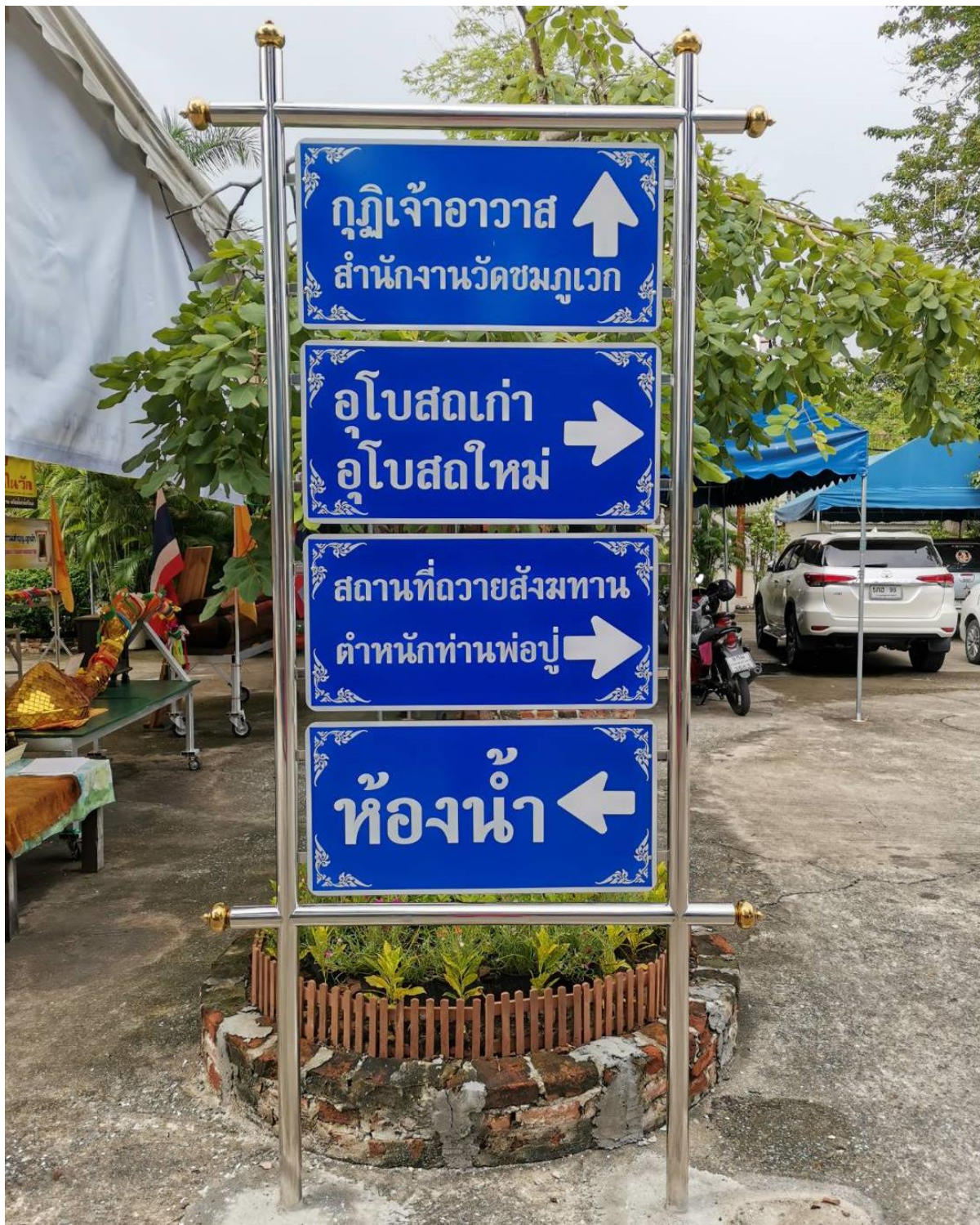
ป้ายบอกทิศทางจุดต่างๆภายในวัด

จุดที่ ๒ การจัดการจราจร ป้ายจราจรและที่จอดรถ รวมถึงป้ายบอกสถานที่ต่างๆภายในวัด