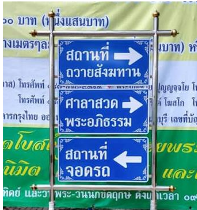
ป้ายบอกทาง